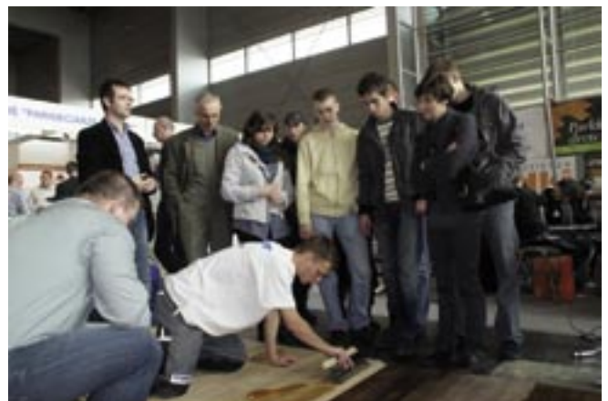
Pokazy układania parkietu – olejowanie