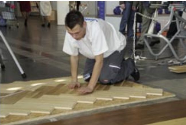
Pokazy układania parkietu – klejenie