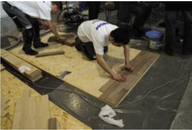
Młodzi parkieciarze z firmy Nowaks