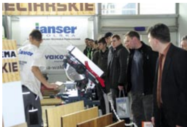
Pokazy układania parkietu – docinanie lementów