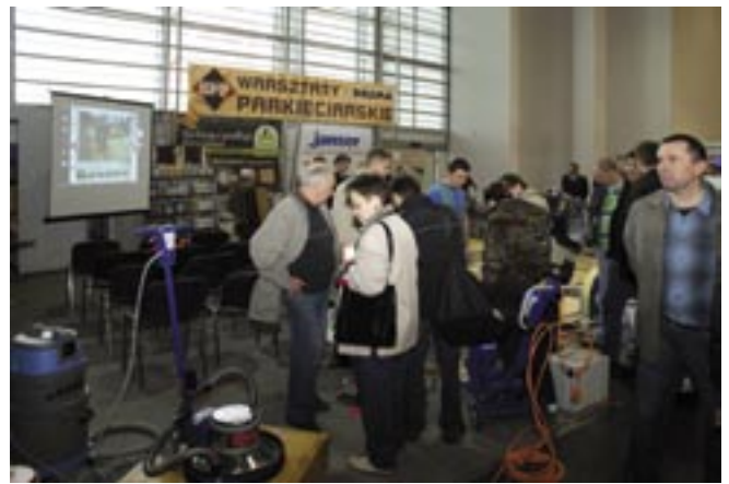
Prezentacje cieszyły się dużym zainteresowaniem

Przedstawiciel Vox Industrie (Globalwood) służył radą i technicznymi informacjami na temat swoich wyrobów. Najwięcej pytań dotyczyło podłóg z bambusa, oferowanych w różnych wykończeniach.