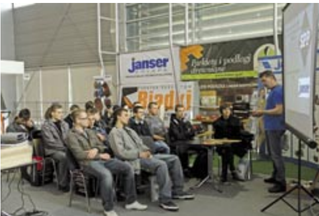
Na temat narzędzi parkieciarskich mówili przedstawiciele Janser Polska