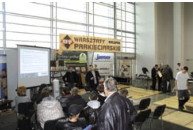
W ramach Warsztatów odbywały się specjalistyczne wykłady (na zdjęciu wystąpienia doradców technicznych Loba Wacol)