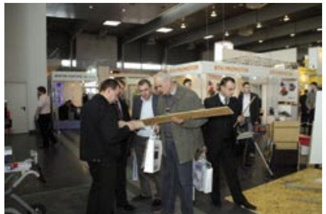
Modne podłogi z bambusa pokazywała firma Vox Industrie