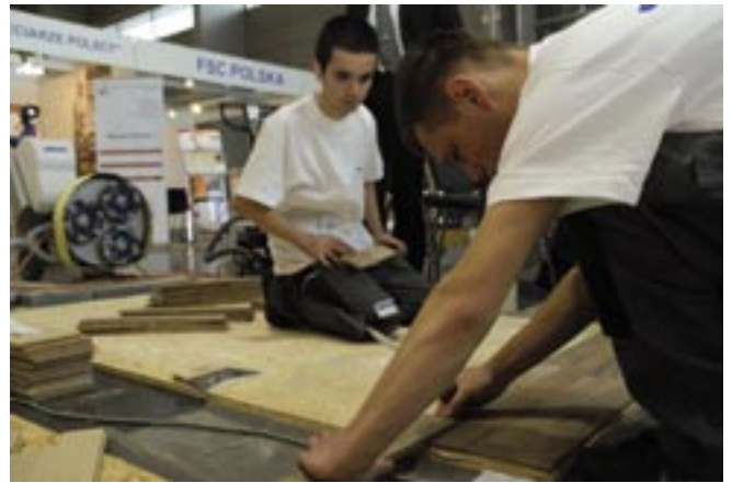
Młodzi parkieciarze z firmy Nowaks