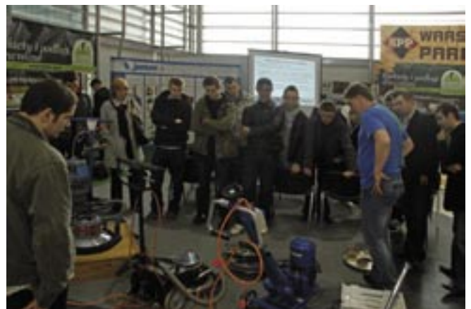
Studenci i uczniowie poznańskich uczelni i szkół brali udział w prezenatacjach w ramach Warsztatów Parkieciarskich