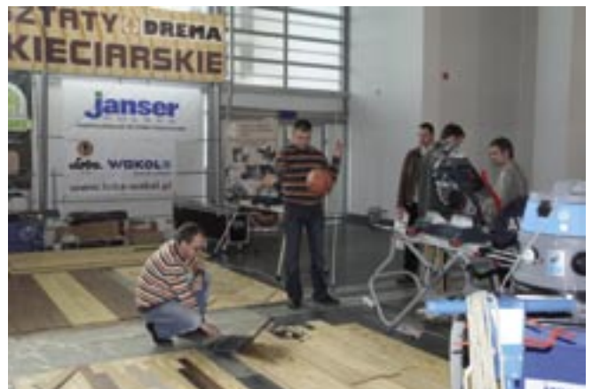
Test odbicia piłki