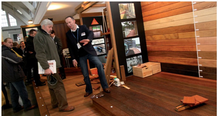
Salon Drewno w budownictwie na poznańskich targach BUDMA cieszy się rosnącą popularnością wśród rzemieślników, wykonawców i architektów.

Salon Drewno w budownictwie jest jedynym w skali kraju miejscem prezentacji produktów i półproduktów drewnianych, które mają zasto-